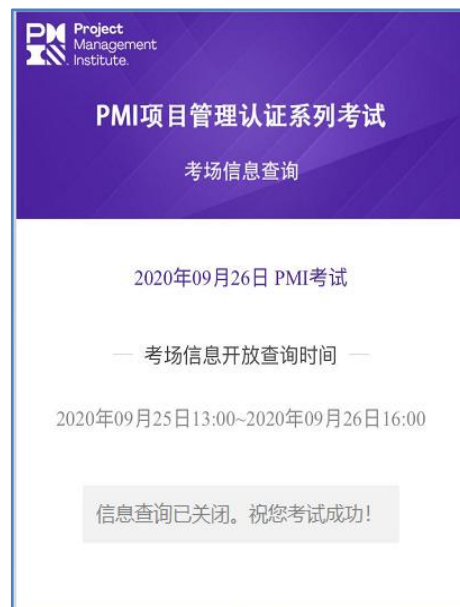
(图四 信息查询已关闭)