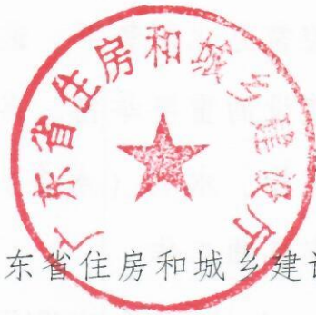
广东省住房和城乡建设厅