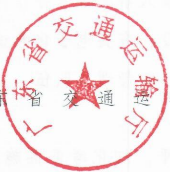
广东省交通运输厅